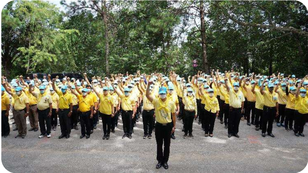
ศึกษาดูงานตามโครงการพัฒนาอาชีพตามแนวทางปรัชญาเศรษฐกิจพอเพียง ประจำปีงบประมาณ ๒๕๖๕ ณ องค์การบริหารส่วนตำบลศรีดอนไชย อ.เทิง จ.เชียงราย

วันเฉลิมพระชนมพรรษา สมเด็จพระนางเจ้า ฯ พระบรมราชินี และจิตอาสาบำเพ็ญสาธารณประโยชน์ ๓ มิถุนายน ๒๕๖๕ ณ ศาลารอยพระบาท บ้านพญาพิภักดิ์ หมู่ที่ ๑๓ ตำบลยางฮ่อม อำเภอขุนตาล จังหวัดเชียงราย